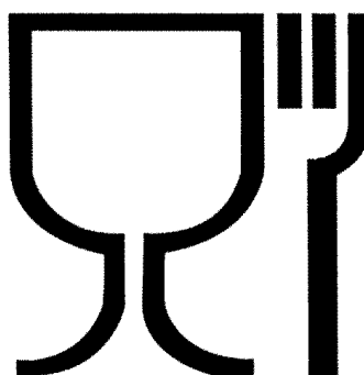
Рис. 1. Упаковка (укупорочные средства), предназначенная для контакта с пищевой продукцией

Список изменяющих документов (в ред. решения Совета Евразийской экономической комиссии от 18.10.2016 N 96)